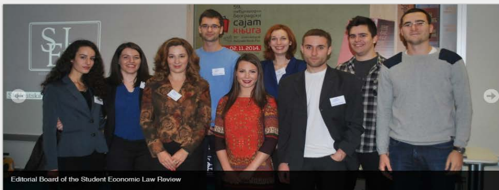
Editorial Board of the Student Economic Law Review

The Student Economic Law Review is a practitioner and scientific legal journal edited by students of the University of Belgrade Faculty of Law, focused on legal aspects of the economy. It is not only a journal publishing students' papers, but the very first student-edited law review in Serbia, and one of the first of its kind in South-East Europe. The Review was established with a vision that students' contributions to academic thought can be considerable, and that young legal minds must not be underestimated. The goal of the Review, therefore, is to transform the gifted students from passive receivers of legal education into active creators of the scholarly work. Although the Review is primarily an undergraduate journal, contributions from students of master and doctoral studies from Serbia and abroad are published as well.