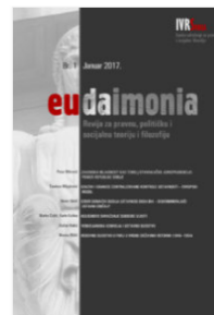
Eudaimonia Br. 1 (2017)